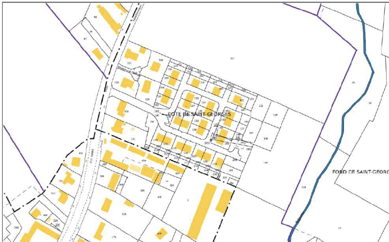
Parcelles section AK N°200 et AK N°211